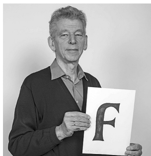
Visuel 12 Portrait de Gerard Unger.